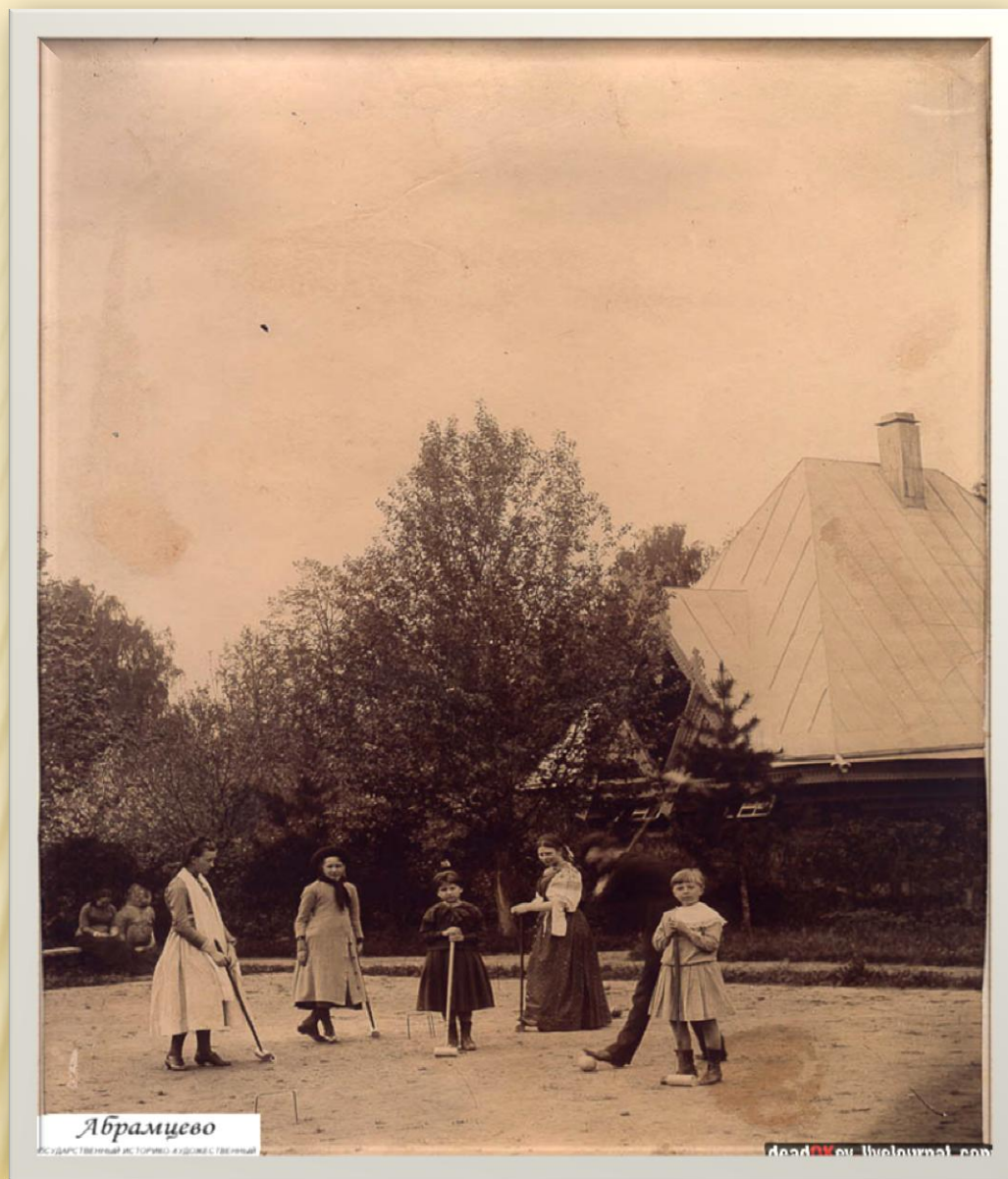
Фото 1880-х годов. Площадка для игры в городки рядом с Баней-теремком.