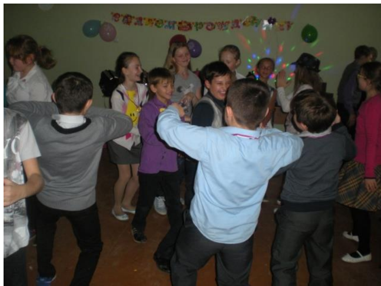
Путешествие в страну Имениню