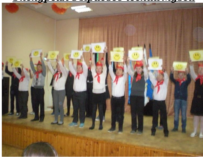
Битва хоров «Звени, Пионерия!»