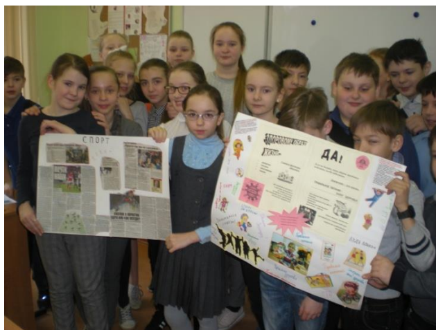
Здоровому образу жизни – «Да!»