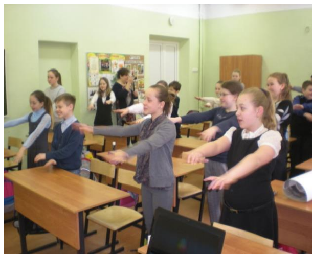
На зарядку становись