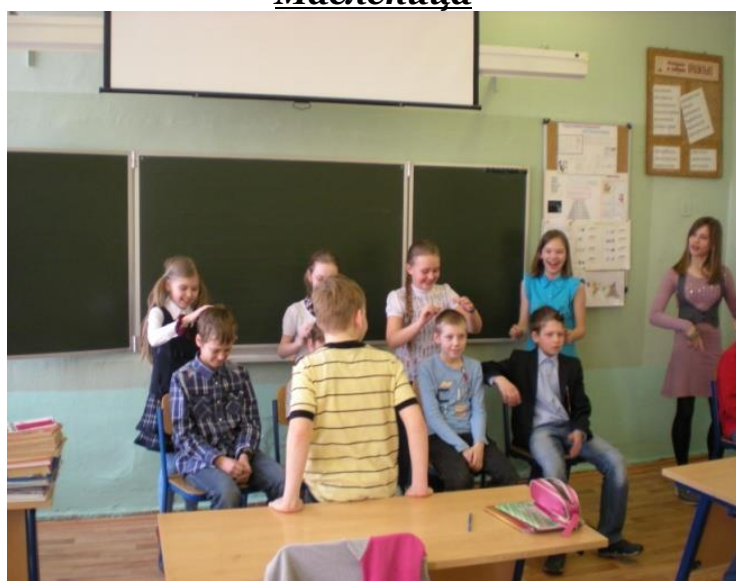
Совместное мероприятие 23 февраля и 8 марта