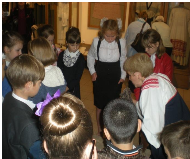
Экскурсия в Краеведческий музей