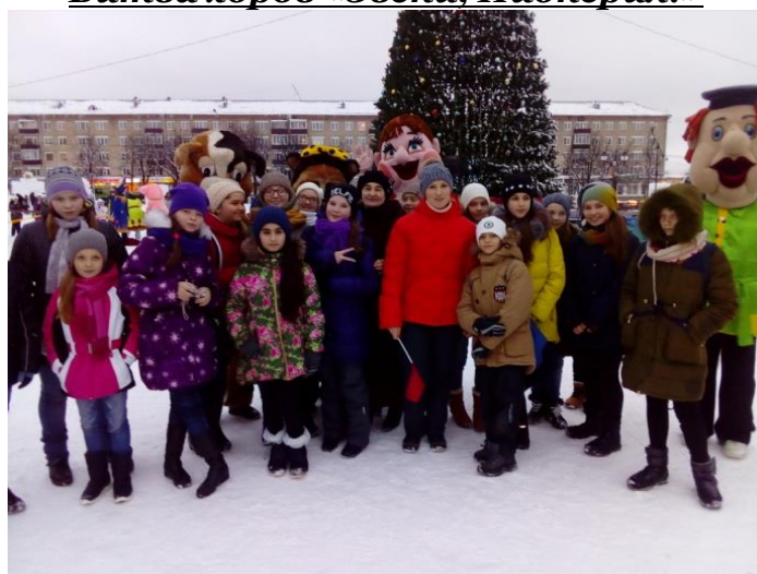
На церемонии зажжения огней на муниципальной ёлке