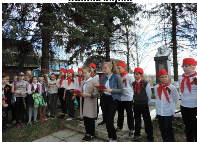
Митинг в д.Зубачево