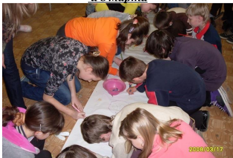
Выбираем дорогу добра