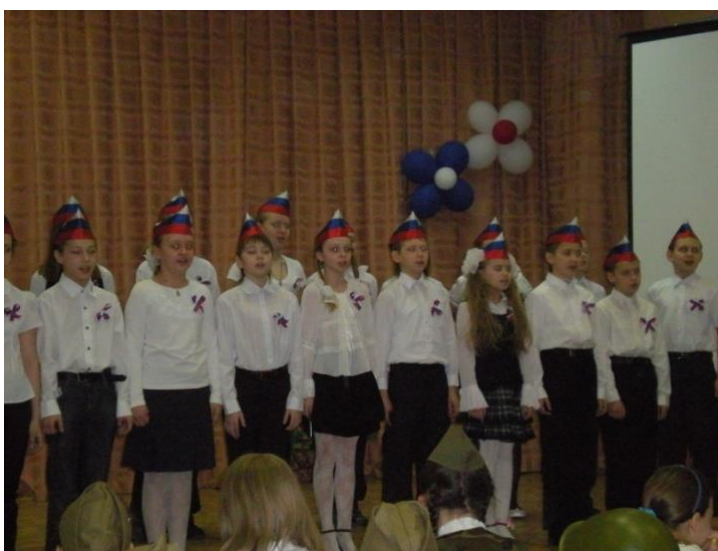
Конкурс песен о России