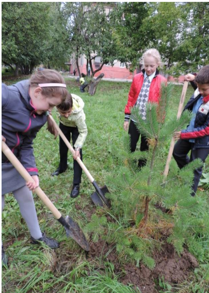
Посади своё дерево