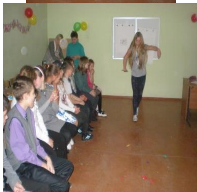
Алло, мы ищем таланты