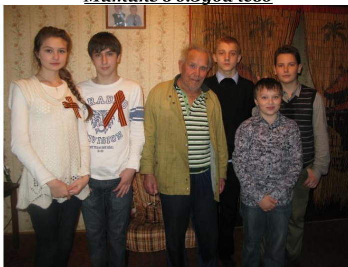
День пожилого человека