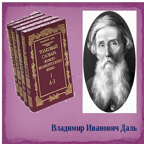
Владимир Иванович Даль